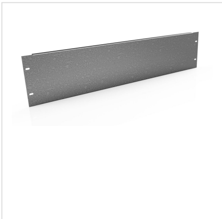
PUA płyta montażowa uniwersalna